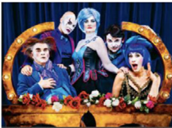
Le quintette interprète le répertoire lyrique avec un ton totalement débridé.

«La Traviata» (Verdi), «La flûte enchantée» (Mozart) et «Carmen» (Bizet) ont été les opéras les plus joués entre 2011 et 2016.